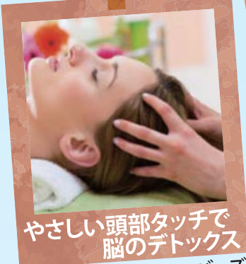
やさしい頭部タッチで 脳のデトックス