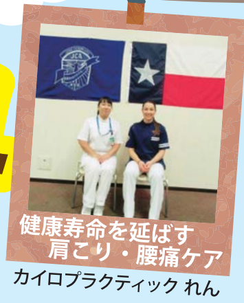
健康寿命を延ばす 肩こり・腰痛ケア