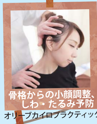
骨格からの小顔調整、 しわ・たるみ予防