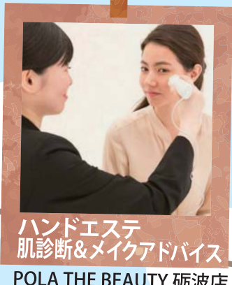
ハンドエステ 肌診断&メイクアドバイス