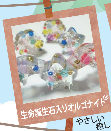
生命誕生石入りオルゴナイト®