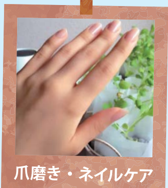
爪磨き・ネイルケア